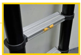
✓ CONFORT ! Marches antidérapantes largeur 65 mm

ALUMINIUM ANODISÉ NE SALIT PAS LES MAINS