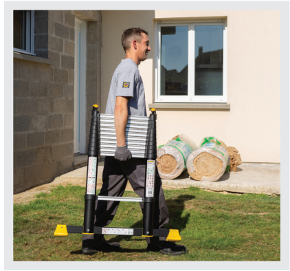
✓ COMPACT ! Super compacte pour transport et rangement aisé.