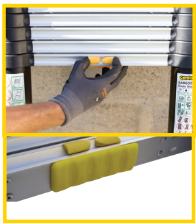
✓ PRATIQUE ! Déverrouillage facile par une seule main.

Montants en aluminium anodisé pour garder les mains propres.