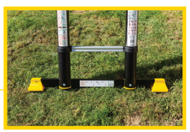
✓ STABLE ! Patins antidérapants.