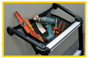
SAC PORTE-OUTILS INTÉGRÉ