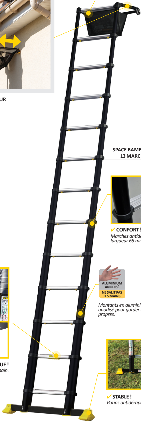
SPACE BAMBOO 13 MARCHES