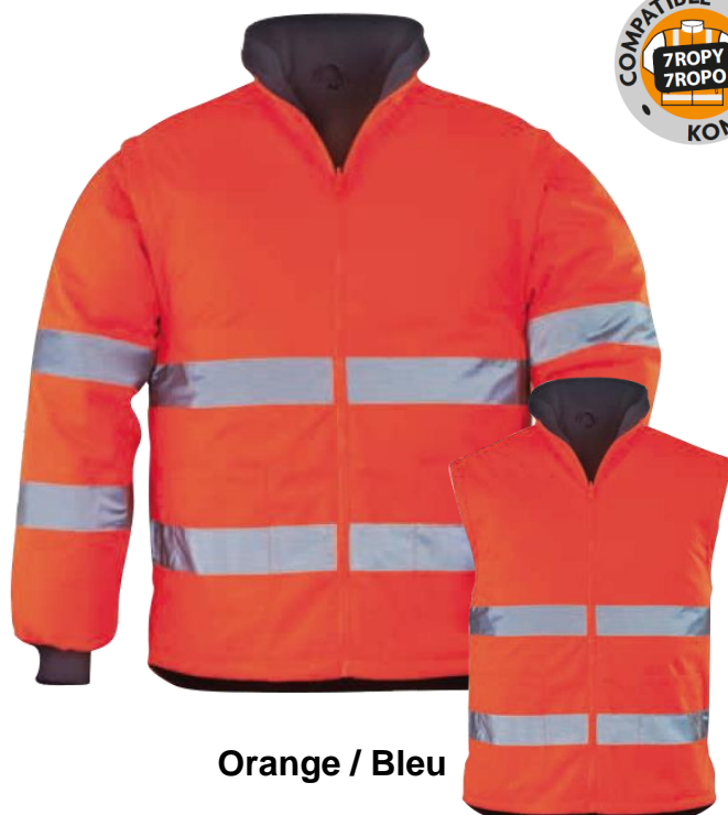
Orange / Bleu

Attention : ce modèle taille petit. Prenez une taille supérieure à celle que vous prenez habituellement