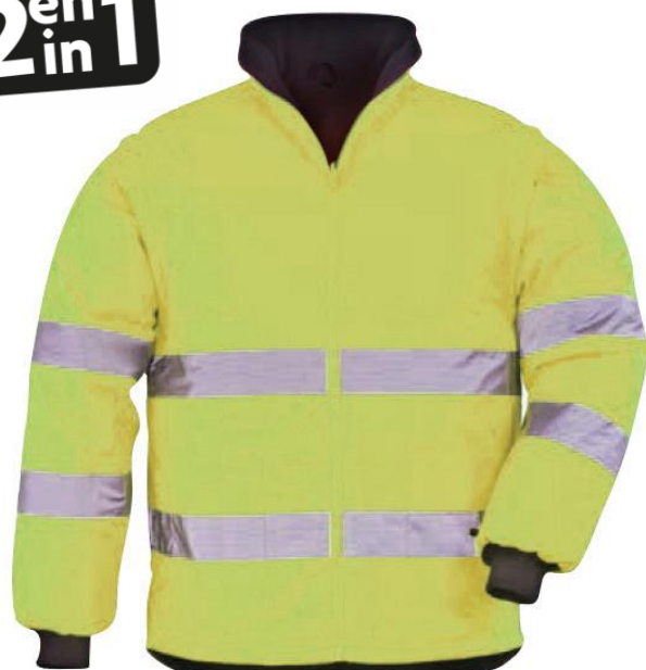
Jaune / Bleu