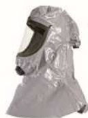
CAGOULES T-AIR HOOD POUR PROTECTION CHIMIQUE