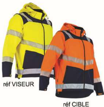
Veste SOFTSHELL HV 2 en 1 MANCHES AMOVIBLES