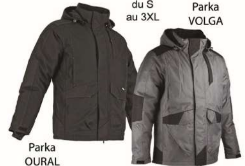
PARKA PREMIUM LMA