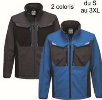
Veste SOFTSHELL WX3 T750