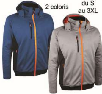
Veste SOFTSHELL VOLGA