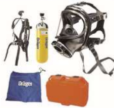
KIT ARI R-PAS COMPLET