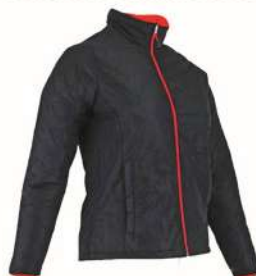
Doudoune Matelassée LAPONIE