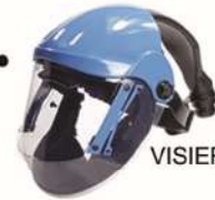
VISIERE DE PROTECTION T-AIR VISOR