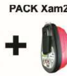
PACK Xam2500 + PARAT 3100 AR005987