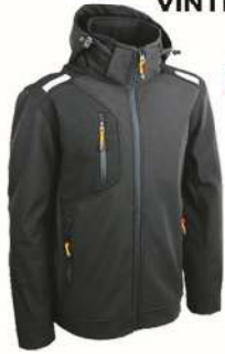
Veste SOFTSHELL VINTER