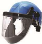
COMBINE T-AIR VISOR CASQUE DE SECURITE/VISIERE