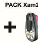
PACK Xam2500 + PARAT 3200 AR005988