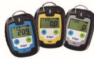
DéTECTEUR MONOGAZ PAC6000