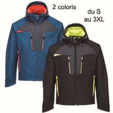
Veste SOFTSHELL DX474