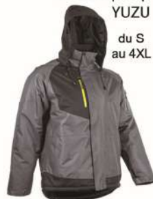
PARKA PRO DOUBLURE POLAIRE