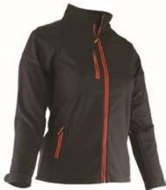
Veste Softshell ALBA