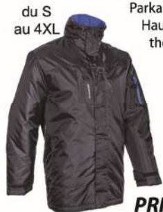
PARKA THERMIQUE PANDA

du S au 4XL Parka Matelassée Haut pouvoir thermique