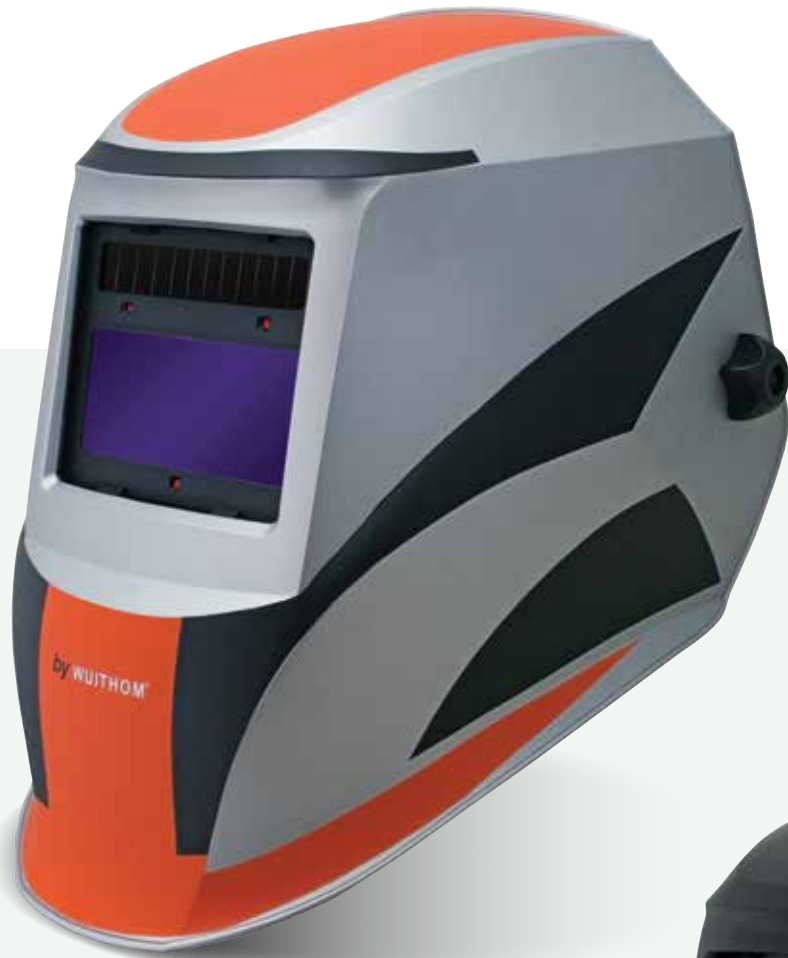
NEOPRO 7 WUITHOM