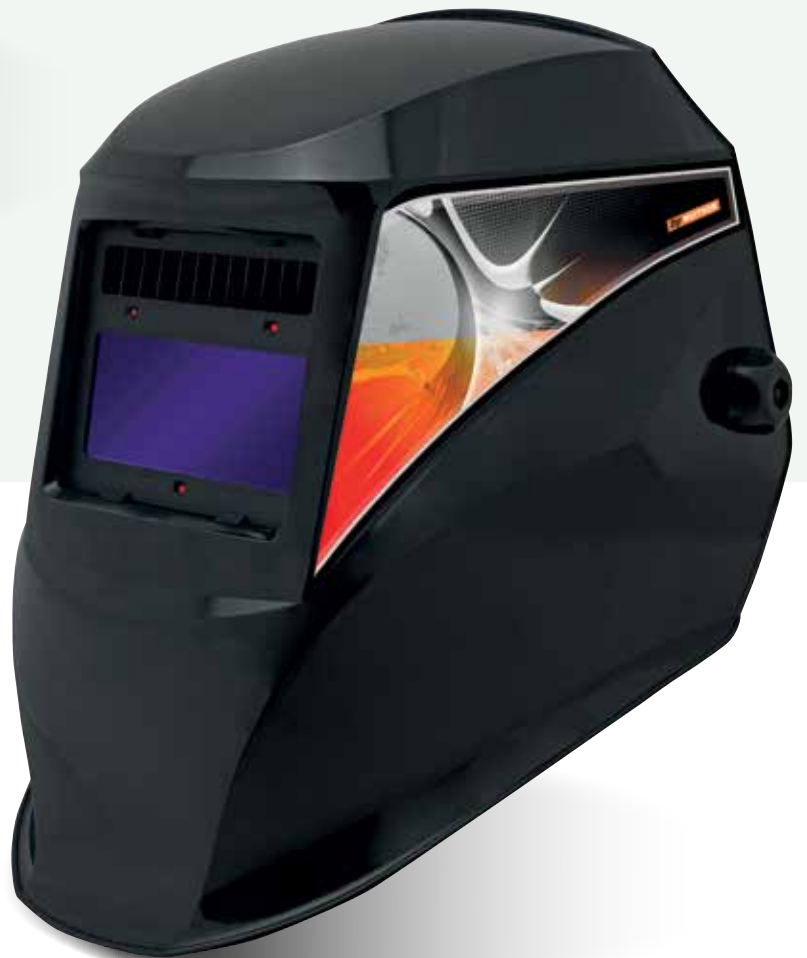
NEOPRO 2 NOIR BRILLANT