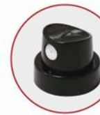
EROGATORE PRODOTTI VERNICIANTI NERO/BIANCO BLACK/WHITE PAINTING PRODUCTS ACTUATOR