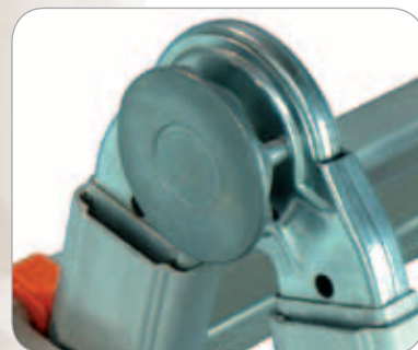
Articulation automatique en acier