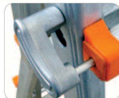
Poignée de blocage en fonte d'aluminium et acier inoxydable