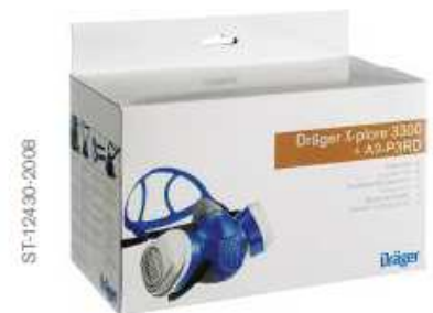
Dräger X-plore® 3300 avec filtres à baïonnette Dräger.