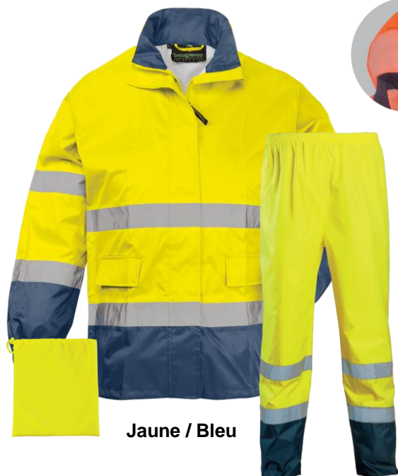
Jaune / Bleu