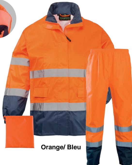
Orange / Bleu