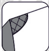
Renfort matelassé épaule