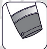
Poignet réglable par pressions