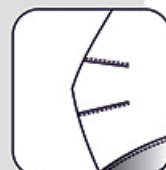
Pincés au coudes