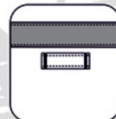
Passant sur poitrine droite