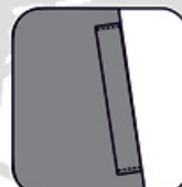
Poches basses sous rabats